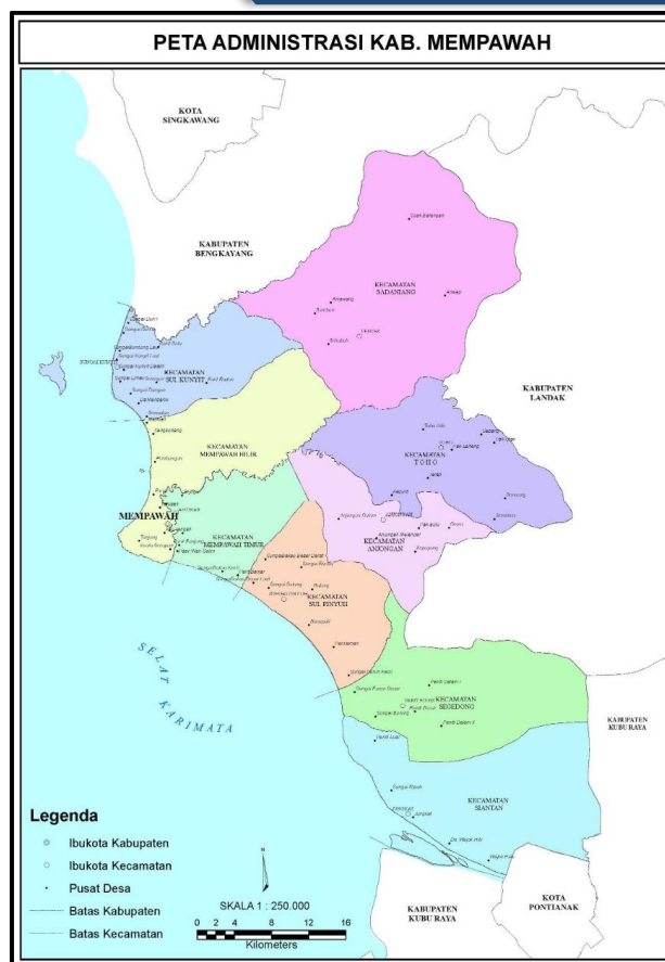
Gambar 2.1. Peta Administrasi Kabupaten Mempawah